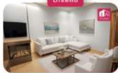
DECORACIÓN VIRTUAL IA