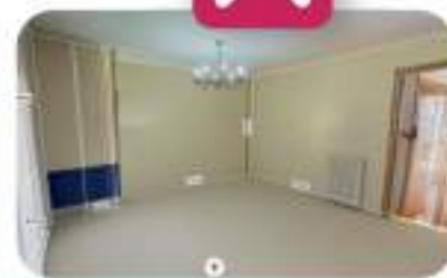
VISITA INMERSIVA 3D